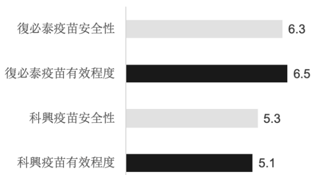
圖四：對不同疫苗廠牌的信心