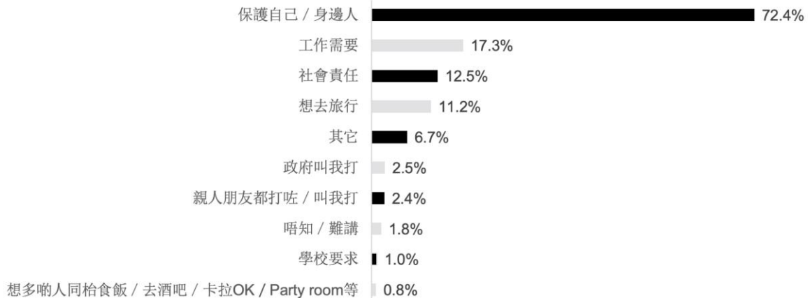
圖三：受訪者接種疫苗的原因